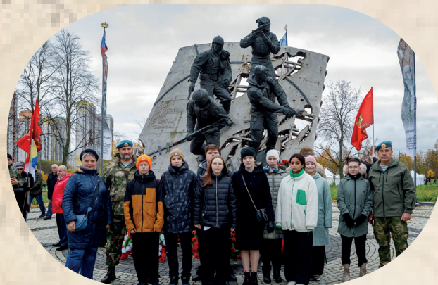
Возложение цветов в парке Интернационалистов

торжественное открытие музея «Спецназ за Отечество!» и двух мемориальных досок, установленных в честь